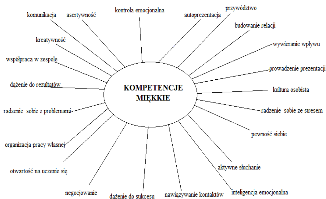
Rysunek 1. Komponenty miękkich kompetencji pracowniczych

W literaturze przedmiotu spotykamy pojęcia kompetencji miękkich, rozumianych jako umiejętności osobiste, społeczne, interpersonalne, komunikacyjne, oraz kompetencji twardych, rozumianych jako cechy konkretne, mierzalne, niezbędne do wykonywania danej pracy. Elementy składowe przynależne kompetencjom miękkim i twardym zostały graficznie zaprezentowane na Rysunku 1 i Rysunku 2 . Ich analiza wykazuje wyraźną odrębność jednych i drugich.