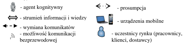
Rysunek 1. Architektura systemu CIMIS