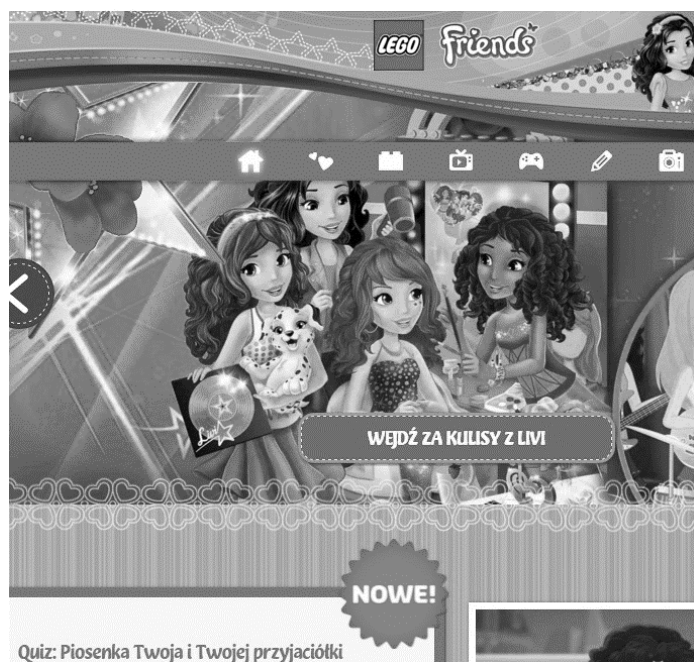
Rysunek 2. Mikrostrona internetowa dedykowana Lego Friends