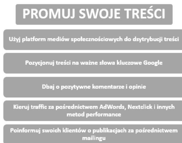
Rysunek 1. Sposoby promowania treści w strategii content marketingowej

Kolejnym krokiem jest adekwatne przygotowanie do działań – najpierw należy określić, gdzie w przestrzeni internetowej przebywa potencjalny klient (np. Google, social media , blogi branżowe). Następnie trzeba dokładnie zaplanować akcję content marketingową (stworzenie harmonogramu działań) – opracować treści, wybrać typ publikacji oraz wytypować odpowiedni czas kampanii (uwzględniający np. sezonowość, trendy). Należy także zsynchronizować wszystkie działania w Internecie z akcją content marketingową i informować na bieżąco osoby zainteresowane (np. fani na Facebooku czy obserwujący na Instagramie) o nowościach, ciekawostkach itp. Następnym etapem jest przystąpienie do działania, tj. przygotowanie treści najlepiej dopasowanych do odbiorców, tak aby przyniosły realną korzyść – muszą one być wartościowe i prezentować wysoki poziom jakości. Dodatkowo warto zadbać, aby były łatwo dostępne i przystępne w odbiorze oraz aby naturalnie wpływały na duże zaangażowanie odbiorców. Niezbędne jest także zadbanie o osiągnięcie możliwie najwyższej pozycji w wynikach wyszukiwarek internetowych. Na tym etapie można przystąpić do publikacji treści. Potem trzeba jeszcze zadbać o promowanie treści – wybrane sposoby promowania przedstawia Rysunek 1 .