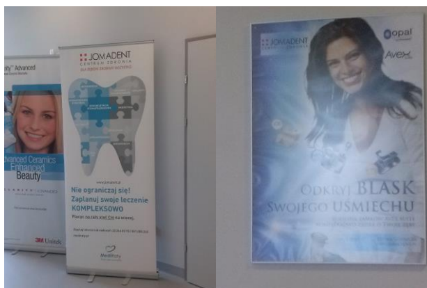
Rysunek 2. Przykładowe banery reklamowe z logo placówki leczniczej – budowanie wizerunku placówki

W placówce mogą się także znajdować tablice informacyjne, których wygląd powinien współgrać z całą placówką. Poniżej, na Rysunku 2 , ukazano inne możliwości budowania własnego wizerunku zakładu leczniczego za pomocą umieszczenia logo/nazwy na plakatach reklamowych.