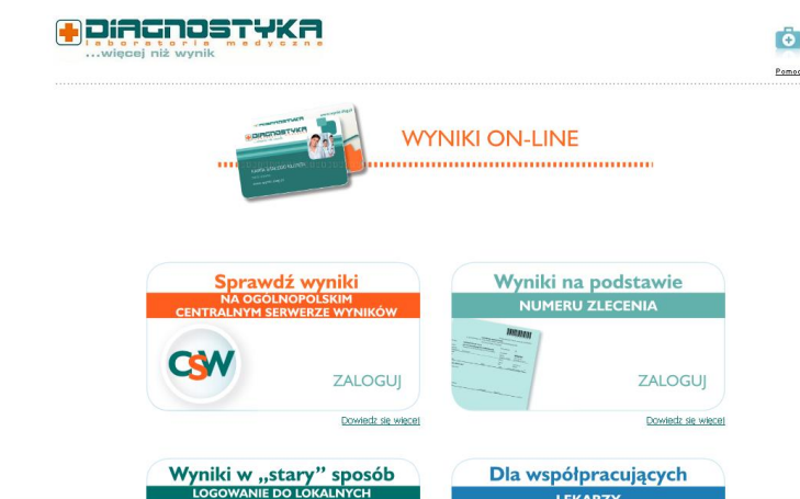
Rysunek 5. Przykładowa strona dostępu do danych on-line