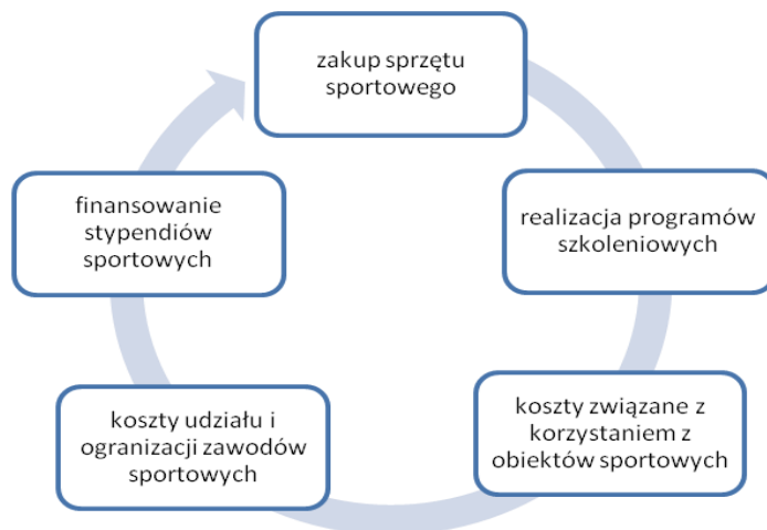
Rysunek 2. Przykładowe wykorzystanie dotacji celowej przyznanej klubowi sportowemu z budżetu JST

cy zostać przeznaczona między innymi na zakup sprzętu sportowego czy też realizację programów szkolenia sportowego (rysunek 2) 7 .